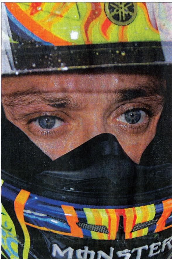
Gli occhi di Valentino Rossi, 30 anni: specchio dell'anima e del talento

SEGRETI Il dottor Vittorio Roncagli è l'uomo che di quegli occhi ha scoperto i segreti. E oggi può raccontare perché negli occhi del nove volte campione del mondo risieda la causa ultima di un talento che non ha uguali al mondo. Oppure, meglio, il riflesso (tanto per restare in tema) di un tocco divino o di un processo evolutivo particolarmente benevolo. Roncagli, oltre a far parte dello staff della Clinica Mobile, è specialista in optometria e medicina oculistica per lo sport nonché presidente dell'Accademia europea di Sport Vision, un fondamentale polo di ricerca sulle implicazioni dell'attività visiva nelle competizioni. Dove si insegna il «visual training», una tecnica di allenamento utile a incrementare il potenziale dei propri occhi. Lui ha «testato» gli occhi di Vale prima del Qatar e di molti altri protagonisti del moto-